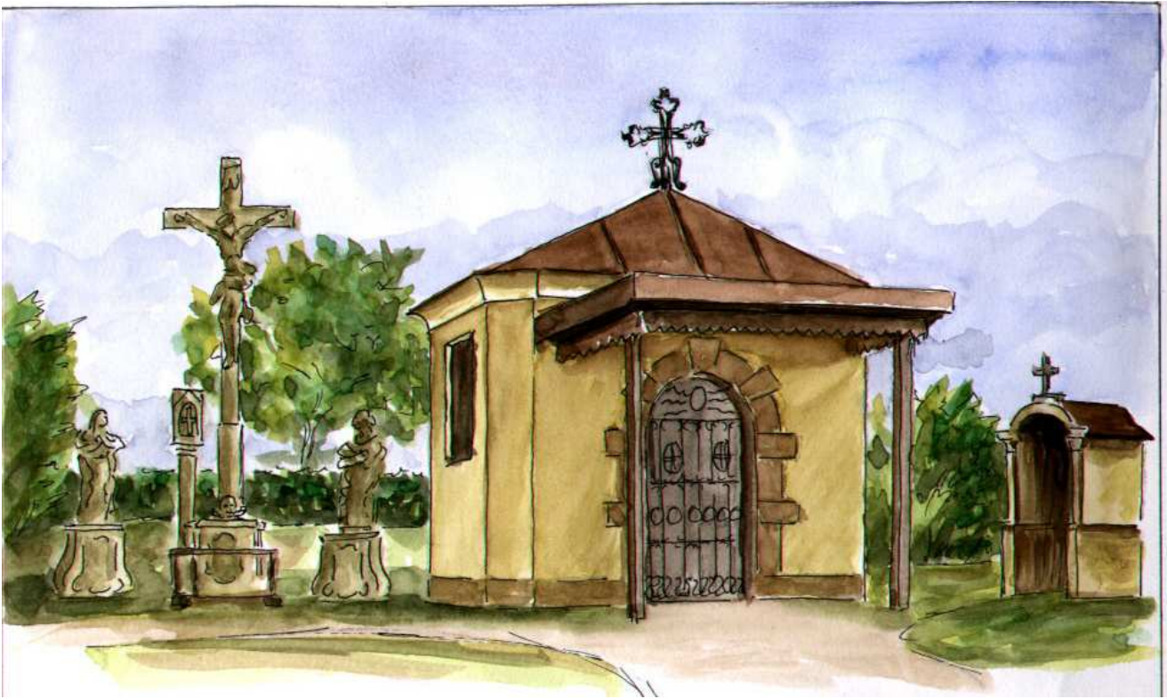
Aquarell von Roland Rottenberger