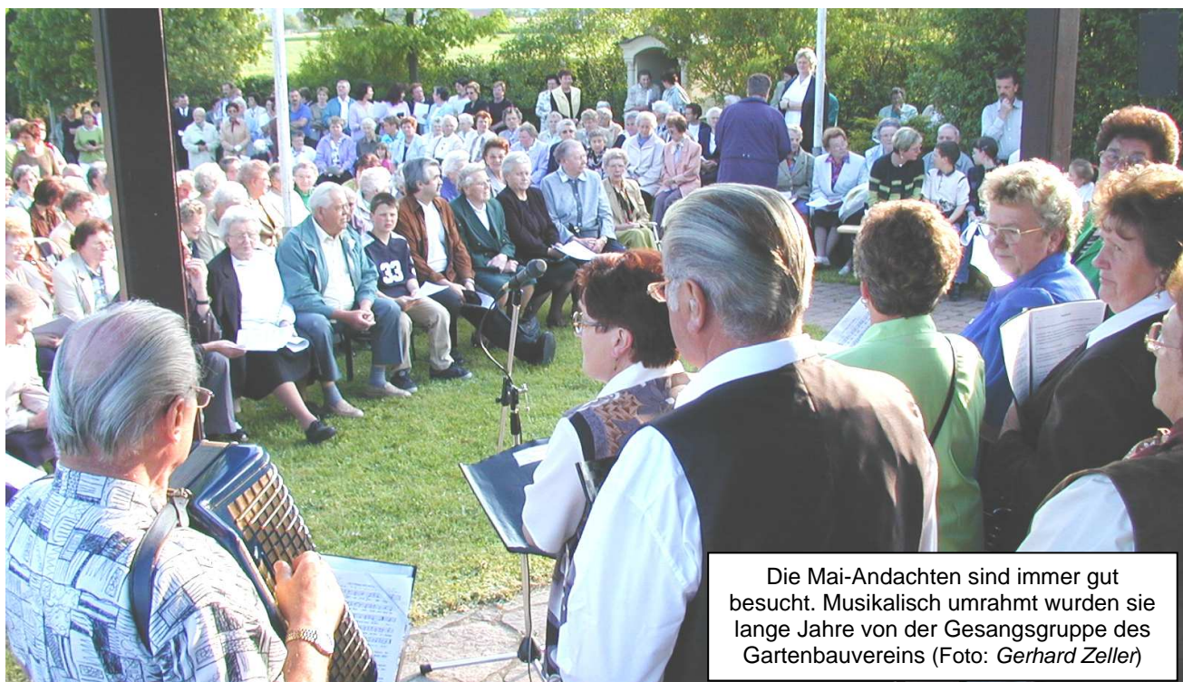
Die Mai-Andachten sind immer gut besucht. Musikalisch umrahmt wurden sie lange Jahre von der Gesangsgruppe des Gartenbauvereins