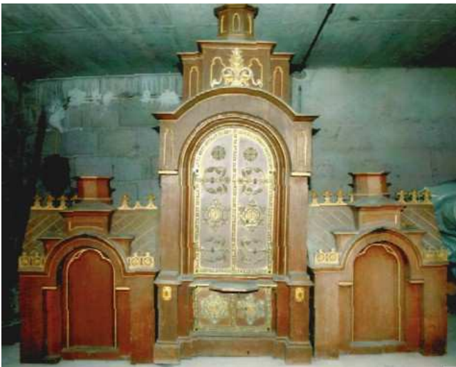
Der ehemalige Hochaltar von Valentin Weidner in der Klosterkirche von 1885 bis 1972

Aufgrund des Gesuchs der Kirchenverwaltung Frauenroth um die Neuanschaffung einer Orgel und eines Ciboriums (Aufbewahrungsort für geweihte Hostien) erklärte sich das Königliche Staatsministerium des Innern für Kirchen- und Schulangelegenheiten in München im Oktober 1886 bereit, die Kosten zu übernehmen.