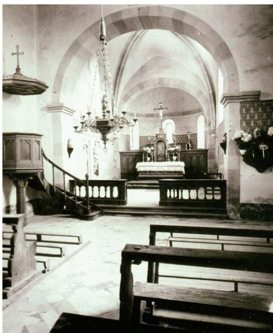
Alle Gegenstände von 1887 wie der Hauptaltar mit Figuren, die Kanzel, die Kommunionbank sowie der Kronleuchter wurden 1972 wieder aus der Kirche entfernt. Im Chorbogen kann man noch die beiden Holzbüsten erkennen.