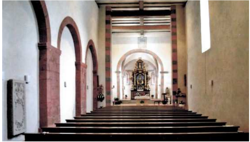
Die Klosterkirche nach der Renovierung von 1972