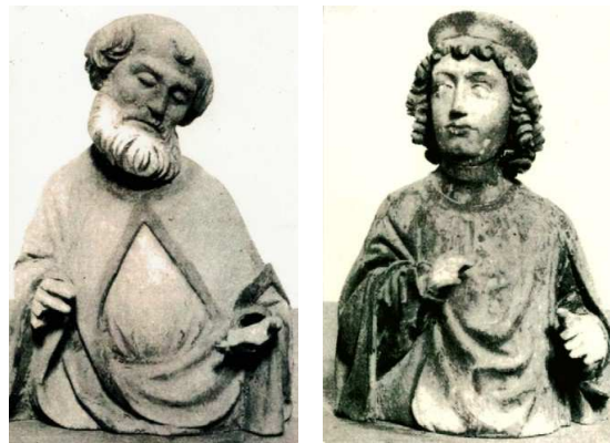
Die Büsten des Hl. Petrus und Vitus oder Sebastian (spätgotisch um 1500)

Beim Aufsuchen der ursprünglichen Fußbodenhöhe wurde das aus Bruchsteinen gemauerte Stiftergrab, zwei weitere aus Bruchsteinen gemauerte und überwölbte Gräber und zwei Grabplatten aus dem 17. Jahrhundert freigelegt. Im hinteren Teil der Kirche wurden auch Menschenschädel und Knochen bei dieser Ausgrabung