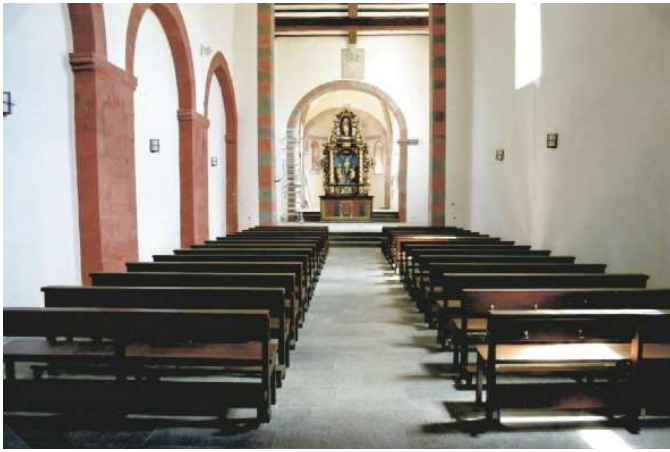
Die ehemalige Klosterkirche ab dem Jahre 2015, nun mit Mittelgang