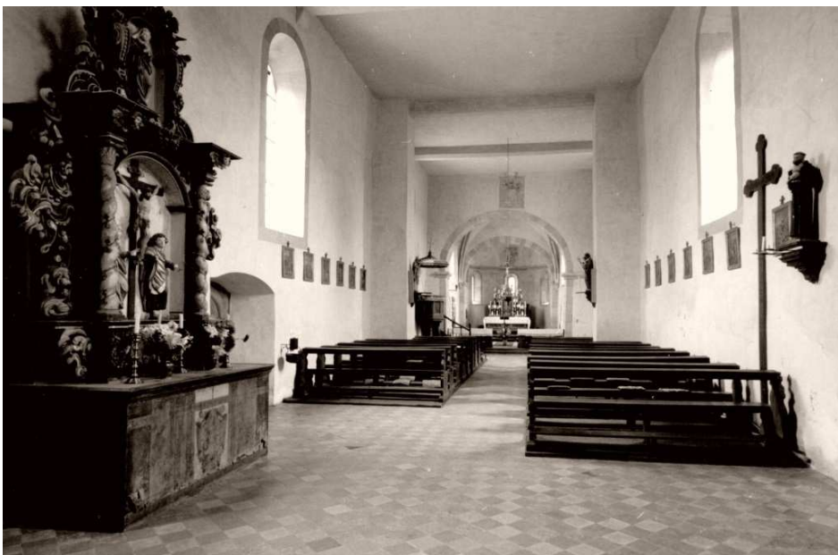
Foto: der ehemalige Hauptaltar aus dem 17. Jahrhundert, der nun zum Nebenaltar geworden war. Vorne: der neue Hauptaltar, die Kanzel und die Kommunionbank von Valentin Weidner. An den Wänden: die 14 gestifteten Kreuzweg-stationsbilder. Gegenüber der Kanzel: die Holzfigur des Hl. Josef. Ganz rechts: die Gipsfigur des Hl. Antonius. Von der Decke: der gestiftete Kronenleuchter. Nach der Renovierung im Jahre 1972 wurde der abgestellte Nebenaltar wieder Hauptaltar.

Der Altar von Valentin Weidner sowie die Kommunionbank und die Kanzel wurden beseitigt. Die Holzfiguren auf dem Altar von Valentin Weidner, die Figur des Hl. Josef, der Kronenleuchter sowie die Kreuzwegstationsbilder liegen auf dem Dachboden der Kirche. Die Gipsfigur des Hl. Antonius wurde an seine Stifter zurückgegeben. Die geteilten Kirchenbänke wurden ebenfalls beseitigt; es wurden neue Bänke in einem Block eingebaut.