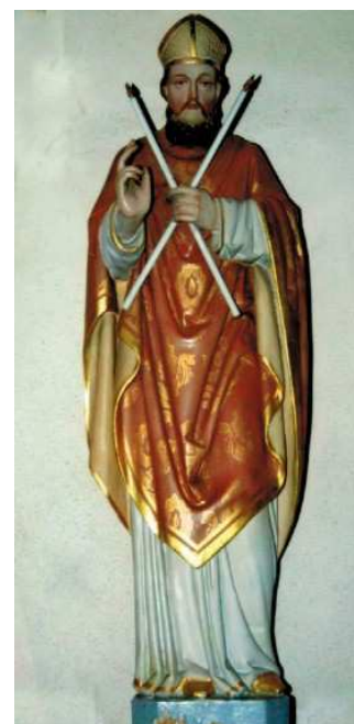
Hl. Blasius von Valentin Weidner

Die Renovierung versuchte den alten Baukörper wieder zur Geltung zu bringen, die Gedanken von 1950, die nachgotische Einrichtung wieder zu entfernen, wurden erneut aufgenommen. Der Unterteil des Hauptaltars, die Kanzel, die Kommunionbank und der Beichtstuhl, Gegenstände, die einst Bildhauer Valentin Weidner im Jahre 1887 schuf, wurden entsorgt. Die Holz-Figuren, wie die Mutter Gottes, der Hl. Johannes sowie die beiden Engel, die einst den Hauptaltar zierten, und die Figur des Hl. Josef, die auf einem Postament an der Wand stand, wurden aus der Kirche entfernt. Zusammen mit den vierzehn, einst gestifteten, Kreuzweg-Stationenbildern, die ebenfalls von den Wänden genommen wurden, und dem Kronenleuchter wurde alles auf den Dachboden der Kirche gebracht, wo sie heute noch lagern. Der Altaraufsatz mit dem Tabernakel blieb auch erhalten, er ist in einem sicheren und trockenen Gebäude