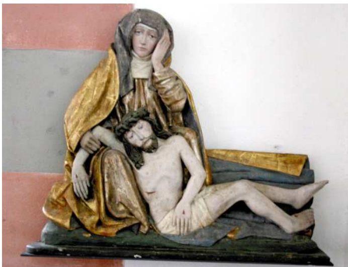
Die spätgotische Pieta im Langhaus