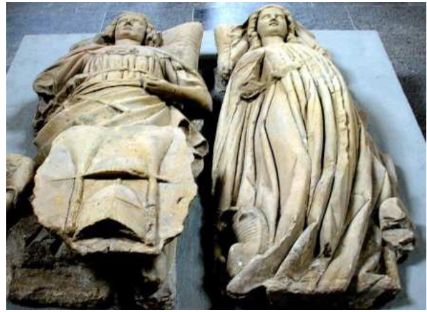
Das Grabmal des Minnesängers Otto von Bodenlauben und seiner Ehefrau Beatrix