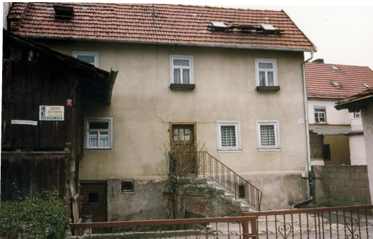
Das Wohnhaus von Franz Blasius Grom kurz vor dem Abbruch im August 2002